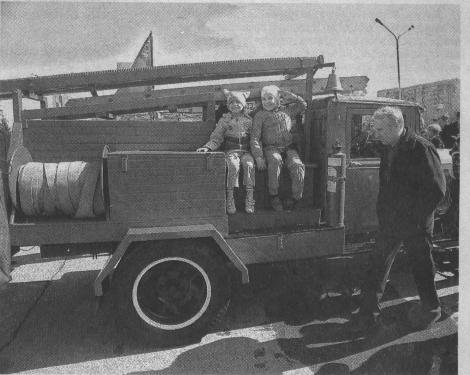
Зрители были активными участниками шоу.