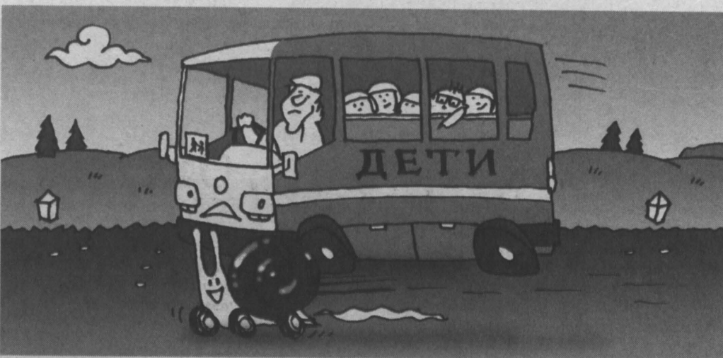
Рисунок Андрея Горшкова.